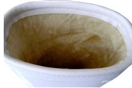
裏目面ノンスリップ構造